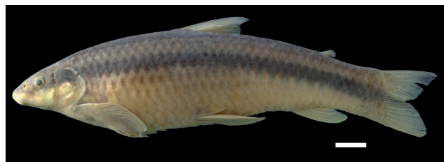
Figura 54. Paratipo de Parodon magdalenensis , IUQ 2367, 126,9 mm LE (escala = 1 cm).

63. Parodon magdalenensis Londoño-Burbano, Román-Valencia y Taphorn 2011