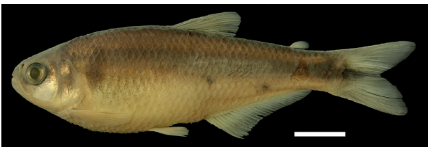
Figura 11. Holotipo de Bryconamericus foncei , IUQ 1941, 68,4 mm LE (escala= 1 cm).

Holotipo (Figura 11): IUQ 1941, 68,4 mm LE; Colombia, Santander, Charala, Vereda Los Chinitos, sistema medio río Magdalena, cuenca del río Fonce, río Pienta vía a Encino ca. 10 km de Charala, 06°13'00"N 73°10'13"O, 1658 m s.n.m.; 17 ene 2008; Román-Valencia y C. García-Alzate.