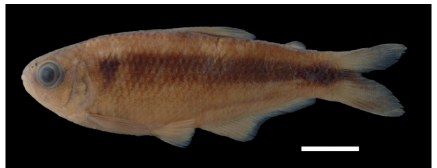
Figura 19. Paratipo de Bryconamericus oroensis , IUQ 3651, 55,6 mm LE (escala = 1cm).

Paratipos (Figura 19): IUQ 3145, 1 CyT, 66,1 mm LE; Ecuador, El Oro, Ortega, 1,5 km NE de Zaruma, 03°39'46"N 79°34'05"O, 930 m s. n. m; 14 may 2004; R. Barriga. IUQ 3148, 1 CyT, 60,6 mm LE; Ecuador, El Oro, Huertas-Jobones; 30 ago 1978; R. Barriga.