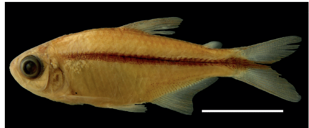
Figura 51. Holotipo de Hyphessobrycon tuyensis , IUQ 1914, 30,4 mm LE (escala = 1cm).

Holotipo (Figura 51): IUQ 1914, 30,4 mm LE; Venezuela, Miranda, drenaje del río Tuy, río Capaya, 10°19'20"N-66°15'12"O, 12 sep 1991.