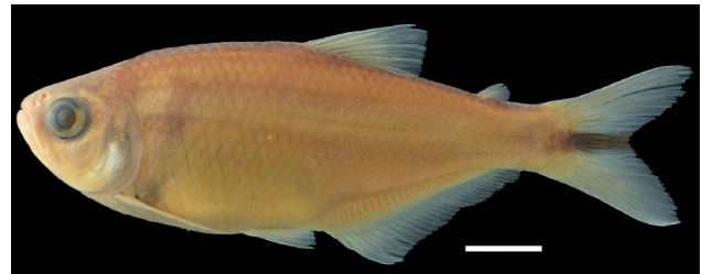
Figura 22. Paratipo de Bryconamericus yokiaie , IUQ 458, 72,7 mm LE (escala = 1 cm).

Paratipos (Figura 22): IUQ 458, 50, 24,1-61, 6 mm LE; Venezuela, Sucre, NO de Guiria, río El Salado; 30 mar 1990; F. Provenzano et al.