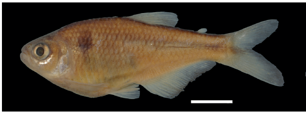
Figura 23. Paratipo de Bryconamericus zamorensis , IUQ 3199, 52,5 mm LE (escala = 1 cm).