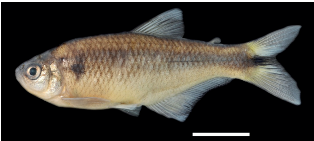
Figura 5. Holotipo de Bryconamericus caldasi , IUQ 3714, 63,7 mm LE (escala = 1 cm).

6. Bryconamericus caldasi Román-Valencia, Ruiz-C., Taphorn y García-Alzate 2014