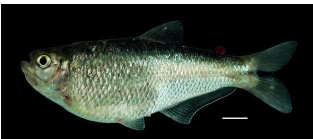
Figura 39. Paratipo de Hemibrycon sierraensis , IUQ 3689, 88,3 mm LE (escala = 1 cm).

Paratipos (Figura 39): IUQ 3629, 2 CyT, 58,9-76,3 mm LE; Colombia, Magdalena, Caribe, río Gaira debajo del puente, Minca, 11°08'37,8"N 74°07'05,1"O, 120 m s.n.m.; 25 ago 2013; C. García-Alzate et al. IUQ 3689, 4, 67,3-88,3 mm LE; colectados con el lote IUQ 3629.