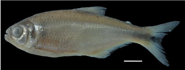
Figura 29. Holotipo de Hemibrycon cardalensis , IUQ 3190, 78,2 mm LE (escala = 1 cm).

33. Hemibrycon cardalensis Román-Valencia, Ruiz-C, Taphorn, Mancera-Rodríguez y García-Alzate 2013