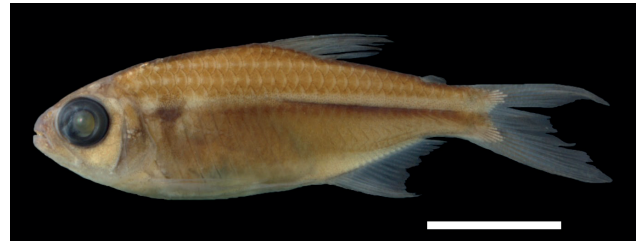
Figura 45. Holotipo de Hyphessobrycon mavro , IUQ 2791, 28,8 mm LE (escala = 1 cm).

51. Hyphessobrycon mavro García-Alzate, Román-Valencia y Prada-Pedrerros 2010