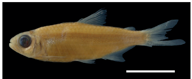
Figura 18. Paratipo de Bryconamericus orinocoense , IUQ 433, 28.9 mm LE (escala = 1 cm).

Paratipos (Figura 18): IUQ 433, 6, 20,7-30,6 mm LE; Venezuela, Amazonas, río Orinoco en playa ca. 0,5 km arriba de La Esmeralda, 12 mar 1987; B. Chernoff et al.