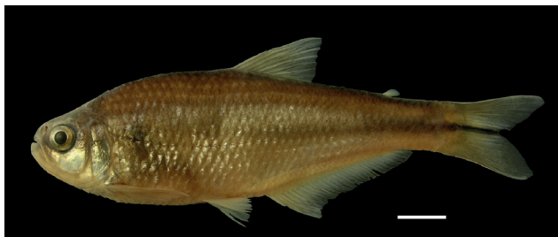
Figura 27. Holotipo de Hemibrycon brevispini , IUQ 2008, 88,6 mm LE (escala = 1 cm).

Holotipo (Figura 27): IUQ 2008, 88,6 mm LE; Colombia, Quindío, Calarcá, alto Cauca, río Quindío, quebrada La Venada, afluente río Santo Domingo, 200 m de la vía quebrada Negra, 04°26'47"N 75°41'02"O, 1278-1304 m s.n.m.; 20 mar 2005; Román-Valencia et al.