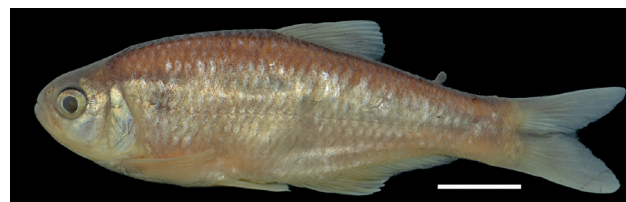
Figura 12. Paratipo de Bryconamericus galvisi , IUQ 311, 52,7 mm LE (escala = 1 cm).