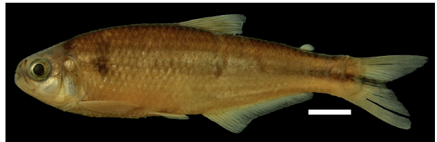
Figura 28. Holotipo de Hemibrycon cairoense , IUQ 2009, 80,9 mm LE (escala = 1 cm).

Holotipo (Figura 28): IUQ 2009, 80,9 mm LE; Colombia, Risaralda, Quinchía, vereda El Cairo, quebrada Los Ramírez, afluente quebrada Itálica, en la vía El Cairo, 200 m arriba del puente, 05°21'43"N 75°43'43"O, 1842 m s.n.m.; 17 oct 2004; Román-Valencia et al.