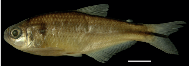
Figura 33. Holotipo de Hemibrycon palomae , IUQ 2727, 65,9 mm LE (escala = 1 cm).

Holotipo (Figura 33): IUQ 2727, hembra, 65,9 mm LE; Colombia, Quindío, Quimbaya, reserva “Montaña El Ocaso”, quebrada La Paloma, afluente río Roble, 04°03’08”N 75°51’06”O, 1103 m s.n.m.; 18 ago 2009; C. García-Alzate et al.