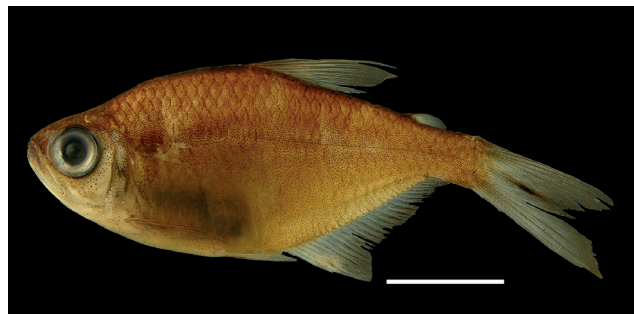
Figura 49. Holotipo de Hyphessobrycon sebastiani , IUQ 1942, 39,5 mm LE (escala = 1 cm).

Holotipo (Figura 49): IUQ 1942, macho, 39,5 mm LE; Colombia, Pacífico, Chocó, Istmina, cuenca del río San Juan, quebrada Patecucho, ca. 05°09'N 76°40'O, 7 ago 2002; T. Silirio.