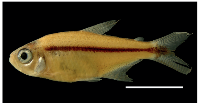
Figura 48. Holotipo de Hyphessobrycon paucilepis , IUQ 1897, 26,8 mm LE (escala = 1 cm).

Holotipo (Figura 48): IUQ 1897, 26,8 mm LE; Venezuela, Lara, embalse los Quediches, canal del aliviadero; 3 sep 1987.