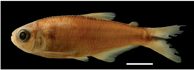
Figura 38. Holotipo de Hemibrycon santamartae , IUQ 2306, hembra, 54,9 mm LE (escala = 1 cm).

Holotipo (Figura 38): IUQ 2306, hembra, 54,9 mm LE; Colombia, Cesar, Atanquez, cuenca bajo río Magdalena, drenaje río Ranchería, Sierra Nevada de Santa Marta, río Santa Clara-Candela, Bongá-Bunkuangueka, ca. 11°00'N 72°46'O, 23 sep 1994.