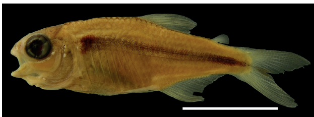
Figura 31. Holotipo de Hemibrycon microformaa , IUQ 510, hembra, 25,8 mm LE (escala = 1 cm).

Holotipo (Figura 31): IUQ 510, hembra, 25,8 mm LE; Colombia, Chocó, Cértegui, cuenca alta río Atrato, río Chintadó, 100 m abajo del puente en la vía Yuto-Cértegui; 24 dic 1997.