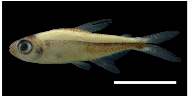
Figura 42. Paratipo de Hyphessobrycon acaciae , IUQ 2492, 21,5 mm LE (escala = 1 cm).

Paratipos (Figura 42): IUQ 2795, 2 CyT, 26,3-28,6 mm LE; Colombia, Meta, Puerto López, Morichal del Estero, ca. 04°04'N 72°57'O, 10 sep 1994; Borissow. IUQ 2433, 49, 18,2-22,1 mm LE; Colombia, Meta,