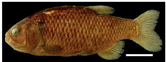
Figura 25. Holotipo de Grundulus cochae IUQ 453, 54,5 mm LE (escala = 1 cm).

Holotipo (Figura 25): IUQ 453, 54,5 mm LE; Colombia, Nariño, Pasto, vereda Romerillo en el canal del embarcadero, 01°05'22"N 77°09'50"O, 2809 m s.n.m.; 17 jul 2000.