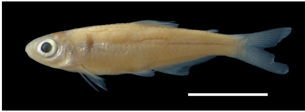
Figura 7. Paratipo de Bryconamericus cinarucoense , IUQ 526, 27,5 mm LE (escala = 1 cm).