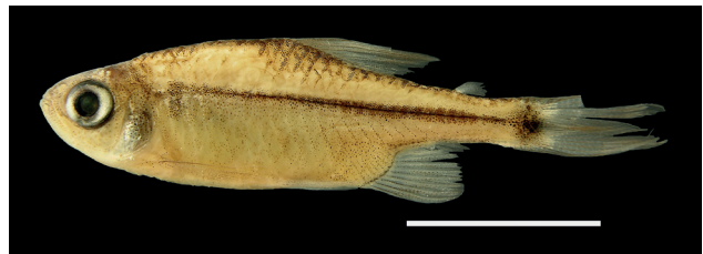
Figura 43. Holotipo de Hyphessobrycon amaronensis , IUQ 2286, 26,5 mm LE (escala = 1 cm).

Holotipo (Figura 43): IUQ 2286, macho, 26,5 mm LE; Colombia, Putumayo, Puerto Leguizamo, cuenca del río Putumayo, caño Amaron, 00°11'02"S 74°53'14"O, 30 mar 2008.