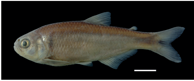
Figura 41. Paratipo de Hemibrycon yacopiae , IUQ 516, 65,9 mm LE (escala = 1 cm).

Paratipos (Figura 41): IUQ 500, 2 CyT, 49,8-50,4 mm LE; colectados con el holotipo, Colombia, Cundinamarca, Yacopí, Hatico-Moral, cuenca media río Magdalena, río Hatico, afluente río Aldana; oct 1995; Román-Valencia. IUQ 515, 4, 21,6-63,1 mm LE; Colombia, Cundinamarca, Yacopí, sistema Magdalena, río Hatico, afluente río Aldana, en la vía Yacopí-Guadualito-La Victoria, 05°31'22"N 74°19'30"O, 761 m s.n.m.; 26 ago 2003; Román-Valencia. IUQ 516, 6, 42,5-90,3 mm LE; Colombia, Cundinamarca, Yacopí, cuenca río Magdalena, quebrada La Mina, en la vía Yacopí-La Mina, 05°25'51" N 74°19'59"O, 1014 m s.n.m.; 27 ago 2003; Román-Valencia.