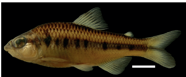
Figura 24. Holotipo de Creagrutus maculosus IUQ 2506, 63,6 mm LE (escala = 1 cm).

Holotipo (Figura 24): IUQ 2506, macho, 63,6 mm LE; Colombia, Meta, Vista Hermosa, Serranía de la Macarena, vereda Buenavista, caño Guadualito, 03°05'34"N 73°51'53"O, 383 m s.n.m.; 12 ene 2009.