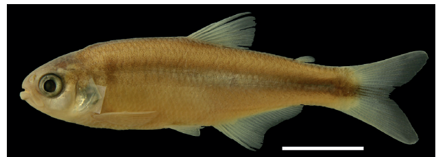
Figura 32. Holotipo de Hemibrycon paez , IUQ 502, 61,1 mm LE (escala = 1 cm).

Holotipo (Figura 32): IUQ 502, 61,1 mm LE; Colombia, Cauca, Inzá, vereda Puerto Valencia, quebrada La Topa, afluente río Páez, a 100 m del puente sobre la vía La Plata-Inzá, 02°30'01"N 75°58'06"O, 1175 m s.n.m.; 30 dic 2002.