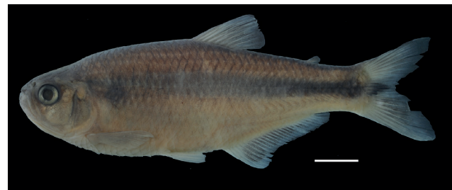
Figura 30. Holotipo de Hemibrycon fasciatus , IUQ 3191, 81,0 mm LE (escala = 1 cm).

34. Hemibrycon fasciatus Román-Valencia, Ruiz-C, Taphorn, Mancera-Rodríguez y García-Alzate 2013