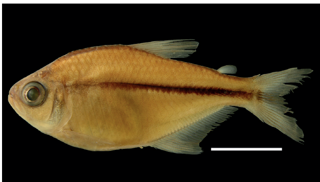
Figura 47. Holotipo de Hyphessobrycon oritoensis , IUQ 1574, 24,6 mm LE (escala = 1 cm).

Holotipo (Figura 47): IUQ 1574, 24,6 mm LE; Colombia, Putumayo, Orito, vereda Calimonte, quebrada La Palma, finca La Palma, ca. 00°41'N 75°52'O, 29 jun 1998; Román-Valencia et al.