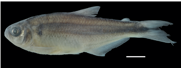
Figura 26. Holotipo de Hemibrycon antioquiae , IUQ 3189, 75,3mm LE (escala = 1 cm).

Holotipo (Figura 26): IUQ 3189, 75,3mm LE; Colombia, Antioquia, San Rafael, parte baja reserva Playas, quebrada Peñoles, afluente del río Guatapé, cuenca media del río Magdalena, 06°16'00,6"N 75°06'00,6"O, 1200 m s.n.m.; 19 jun 2011; N. Mancera.