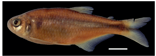
Figura 3. Holotipo de Bryconamericus andresoi , IUQ 447, 64,2 mm LE (escala = 1 cm)

Holotipo (Figura 3): IUQ 447, 64,2 mm LE; Colombia, Nariño, El Tambo, Ricaurte, los Llanos de