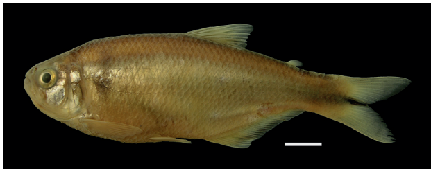
Figura 36. Holotipo de Hemibrycon raqueliae , IUQ 495, 88,9 mm LE (escala = 1 cm).

Holotipo (Figura 36): IUQ 495, 88,9 mm LE; Colombia, Caldas, Samaná, Magdalena medio, cuenca río La Miel, quebrada Tasajo, 05°23'55"N 74°59'05"O, 1482 m s.n.m.; 3 ene 2003.