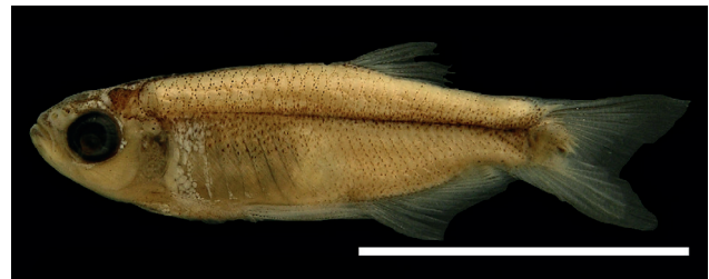
Figura 52. Holotipo de Tytocharax metae , IUQ 2581, 15,3 mm LE (escala = 1cm).

Holotipo (Figura 52): IUQ 2581, 15,3 mm LE; Colombia, Meta, Vista Hermosa, Palestina, cuenca