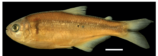
Figura 4. Holotipo de Bryconamericus arilepis , IUQ 1917, 68,9 mm LE (escala = 1cm).

Holotipo (Figura 4): IUQ 1917, 68,9 mm LE, macho; Colombia, Santander, Charalá, vereda La Pontesuela, Magdalena medio, cuenca del río Fonce, quebrada La Pontesuela en la boca de la quebrada Coclina, en la escuela Carrillo, en la vía Cantera a Encino, 06°10’42”N 73°09’44”O, 1457 m s.n.m; 6 feb 2004, Román-Valencia y R. I. Ruiz-C.