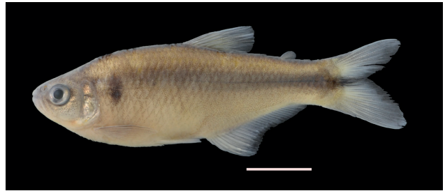
Figura 37. Holotipo de Hemibrycon sanjuanensis , IUQ 3693, 53,5 mm LE (escala = 1 cm).

Holotipo (Figura 37): IUQ 3693, 53,5 mm LE, Colombia, Risaralda, Pueblo Rico, El Recreo, alto río San Juan, río Aguas Claras, tributario río Tatamá sobre la vía Apia-Pueblo Rico, 05°13'04,9"N 76°01'50,1"O, 1519 m s.n.m.