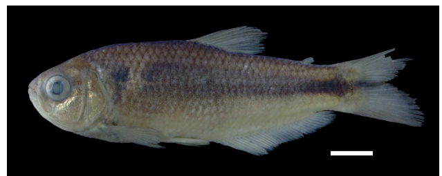
Figura 10. Holotipo de Bryconamericus ecuadorensis , IUQ 3813, 77,1 mm LE (escala = 1 cm).

Holotipo (Figura 10): IUQ 3813, 77,1 mm LE; Ecuador, Esmeraldas, río Santiago, 00°55'53,1"N 78°51'28,1"O, 24 m s.n.m., jun 2014.