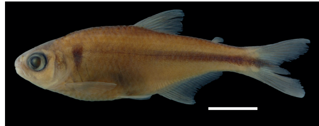
Figura 21. Paratipo de Bryconamericus subtilisform , IUQ 427, 50,2 mm LE(escala 1 cm).

Paratipos (Figura 21): IUQ 427, 25, 30,3-52,3 mm LE; Venezuela, Bolívar, escudo de las Guayanas, cuenca del río Orinoco, drenaje río Caura, río Carapo, 04°10'3"N 63°58'03"O; 28 feb 1990; C. Ferraris.