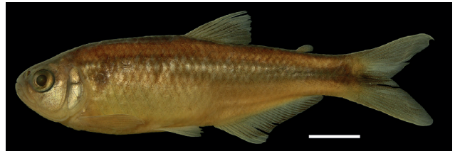
Figura 14. Holotipo de Bryconamericus guizae , IUQ 450, 65,3 mm LE (escala = 1 cm).

Holotipo (Figura 14): IUQ 450, 65,3 mm LE; Colombia, Nariño, Ricaurte, vereda El Palmar, alto río Guiza, quebrada La Chiquita, afluente quebrada Inbi, 300 m del puente vía Ricaurte-Ospina, 01°13'43"N 78°02'11"O, 1041 m s.n.m.; 21 jul 2000; Román-Valencia y F. Pantoja.