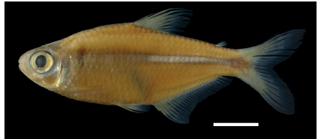
Figura 6. Paratipo de Bryconamericus carlosi , IUQ 397, 51,5 mm LE (escala = 1 cm).

7. Bryconamericus carlosi Román-Valencia 2003