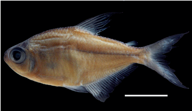
Figura 44. Holotipo de Hyphessobrycon chocoensis , IUQ 3035, 37,1 mm LE (escala = 1 cm).

49. Hyphessobrycon chocoensis García-Alzate, Román-Valencia y Taphorn 2013