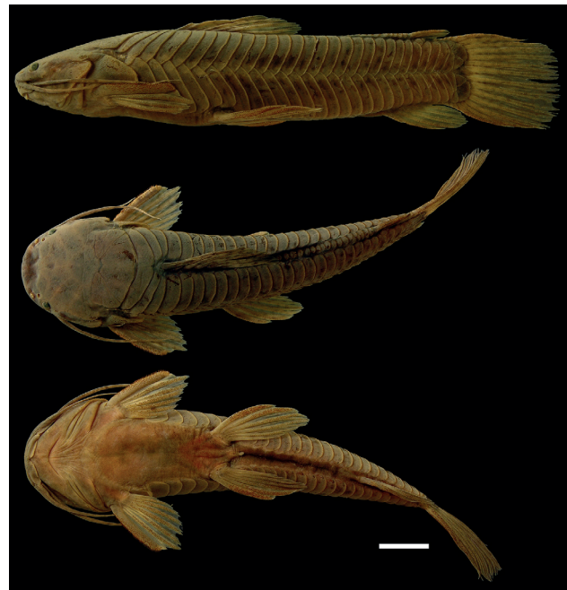
Figura 1. Holotipo de Callichthys fabricioi , IUQ 295, 87,2 mm LE (escala = 1cm).

Holotipo (Figura 1): IUQ 295, 87,2 mm LE; Colombia, Cauca, Buenos Aires, zanjón bagazal, río