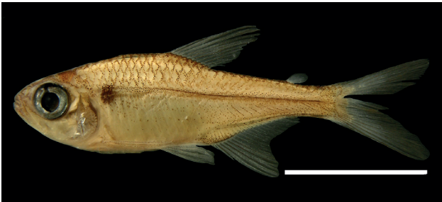
Figura 50. Holotipo de Hyphessobrycon taguae , IUQ 2288, 23,5 mm LE (escala = 1cm).

Holotipo (Figura 50): IUQ 2288, macho, 23,5 mm LE; Colombia, Putumayo, Puerto Leguizamo, quebrada km 2 cerca a Puerto Leguizamo en la vía a La Tagua, 00°10'15"S 74°46'23"O, 189 m s.n.m.; 28 mar 2008.