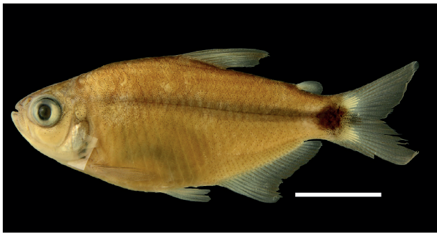
Figura 46. Holotipo de Hyphessobrycon ocaseensis , IUQ 1635, 44,0 mm LE (escala = 1 cm).

Paratipos: IUQ 1414, 3, 16,0-19,1 mm LE; colectados en la localidad tipo; 23 sep 2001. IUQ 1634, 5, 36,4-41,7 mm LE; colectados con el holotipo.