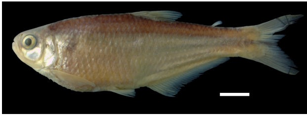
Figura 35. Paratipo de Hemibrycon rafaense , IUQ 509, 81,9 mm LE (escala = 1 cm).

quebrada San Rafael, en la vía a Santuario; 12 abr 1991; Román-Valencia. IUQ 509, 34, 40,4-87,9 mm LE; Colombia, Risaralda, Apia, quebrada San Rafael, desembocadura Río Apia, a 100 m de la vía Santuario-Apia, 05°04'54"N 75°56'36"O, 1253 m s.n.m.; 8 jul 2003; Román-Valencia.