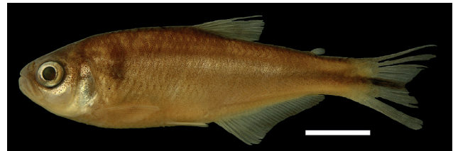
Figura 34. Holotipo de Hemibrycon quindos , IUQ 485, 52,3 mm LE (escala = 1 cm).

Holotipo (Figura 34): IUQ 485, macho, 52,3 mm LE; Colombia, Quindío, Salento, quebrada La Tinaja, ca. 200 m sobre la vía de la vereda Llano Grande-Boquia, 04°36’57”N 75°36’36”O, 1712 m s.n.m.; 4 dic 2002.