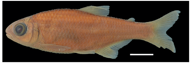
Figura 17. Paratipo de Bryconamericus macrophthalmus , IUQ 428, 63,9 mm LE (escala = 1 cm).

Paratipos (Figura 17): IUQ 428, 3, 38,7-42,8 mm LE; Venezuela, Amazonas, cuenca del río Orinoco, río Negro, raudal debajo de la boca del Casiquiare, ca. 10 km N de San Carlos de Río Negro, 02°02'00"N 67°25'00"O; 26 jun 1978.