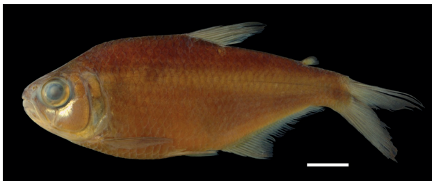
Figura 9. Paratipo de Bryconamericus dahli , IUQ 219, 79,7 mm LE (escala = 1 cm).

Paratipos (Figura 9): IUQ 218, 14, 29,9-43,5 mm LE; Colombia, Nariño, Tumaco, sistema del río Patía, cuenca del río Telembí, quebrada Babosa, afluente del río Sabunde, en la vía km 98, a 2 km, margen derecha; 11 abr 1998; Román-Valencia y J. Fernández. IUQ 219, 13, 19,5-80,8 mm LE; Colombia, Nariño, Tumaco, sistema del río Patía, quebrada Tortuguera en la vía km 98, margen derecha 50 m, 01°24'19"N 78°28'35"O, 31 m s.n.m.; 11 abr 1998; Román-Valencia y J. Fernández. IUQ 220, 4, 37,2-53,4 mm LE; Colombia, Nariño, Tumaco, cuenca del río Mira, quebrada Angostura en la vía km 98, 300 m margen izquierda; 11 abr 1998; Román-Valencia y J. Fernández.