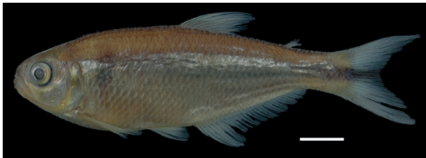
Figura 8. Paratipo de Bryconamericus cristiani , IUQ 381, 82.9 mm LE (escala = 1 cm).

Paratipos (Figura 8): IUQ 381, 17, 40,7-62,6 mm LE; Colombia, Meta, río Ariari, delante de Cubarral, 100 m arriba del puente de la vía al Castillo, 03°46'26"N 73°51'32"O, 690 m s.n.m.; 7 oct 1998; Román-Valencia y J. Tovar. IUQ 382, 11, 26,3-33,1 mm LE; Colombia, Casanare, Yopal, río Cravo sur en finca Guasimal, en la vía Yopal-Paz de Ariporo, 05°21'23"N 72°22'23"O, 404 m s.n.m.; 8 oct 1998; Román-Valencia.