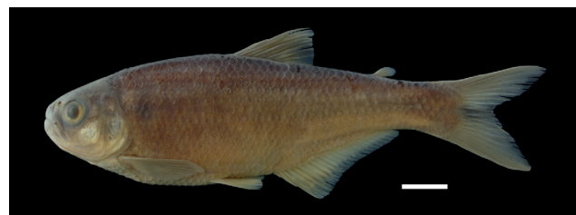
Figura 40. Paratipo de Hemibrycon virolinica , IUQ 521, 90,7 mm LE (escala = 1 cm).

Paratipos (Figura 40): IUQ 501, 1 CyT, 62,7 mm LE; Colombia, Santander, Charala, quebrada Virolín, afluente río Cañaverales; 27 abr 1983; Román-Valencia. IUQ 521, 7, 73,5-91,2 mm LE; Colombia, Santander, Charala, río Virolín, río Cañaverales en la vía Virolín-Sogamoso, 06°05'40"N 73°11'58"O, 1744 m s.n.m.; 4 feb 2004; Román-Valencia. IUQ 522, 5, 83,2-96,9 mm LE; Colombia, Santander, Charala, río Virolina, afluente río Oibita, 200 m delante de Virolín, vía Virolín-Olival, 06°05'40"N 73°11'58"O, 1744 m s.n.m., 4 feb 2004; Román-Valencia.