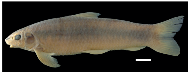
Figura 53. Paratipo de Parodon alfonsoi , IUQ 2614, 94,2 mm LE (escala = 1 cm).

Paratipos (Figura 53): IUQ 2546, 2 CyT, 87,3-95,1 mm LE; Colombia, Cesar, Laguna de Ibiricó, bajo río Magdalena, río Tocuy, afluente río Calenturitas, ca.