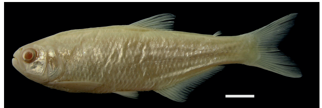
Figura 15. Holotipo de Bryconamericus huilae , IUQ 422, 85,6 mm LE (escala = 1 cm).

Holotipo (Figura 15): IUQ 422, 85,6 mm LE; Colombia, Huila, Guadalupe, vereda Cachimba, sistema río Suaza, alto Magdalena, quebrada La Sapayera, afluente quebrada Viciosa, alrededor del