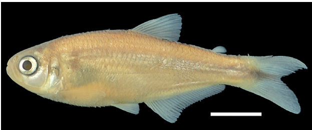
Figura 20. Paratipo de Bryconamericus plutarcoi , IUQ 461, 48.8 mm LE (escala = 1 cm).

Paratipos (Figura 20): IUQ 308, 28, 27,5-47,7 mm LE; Colombia, Santander, quebrada Santa Rosa, cuenca río Suarez, 06°26'09"N 73°18'56"O, 825 m s.n.m.; 6 oct 1998; Román-Valencia y J. Tovar. IUQ 461, 4, 39,1-46,1 mm LE; misma localidad del lote IUQ 308; 24 jun 2001; Román-Valencia et al. IUQ 472, 2, 34,7-34,8 mm LE; misma localidad del lote IUQ 308; 6 oct 1998; Román-Valencia. IUQ 473, 2 CyT, 46,6-61,1 mm LE; misma localidad y fecha del lote IUQ 308; Román-Valencia.