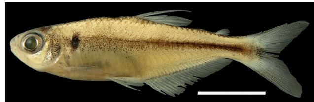
Figura 16. Holotipo de Bryconamericus macarenae , IUQ 2448, 36,2 mm LE (escala = 1 cm).

Holotipo (Figura 16): IUQ 2448, 36,2 mm LE;