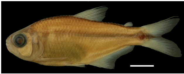
Figura 13. Holotipo de Bryconamericus gonzalezoi , IUQ 377, 58,4 mm LE (escala = 1 cm).

Holotipo (Figura 13): IUQ 377, 58,4 mm LE, hembra; Panamá, Bocas del Toro, río Bongie, 09°21'35"N 82°36'35"O, 23 feb 1996; E. Bermingham.