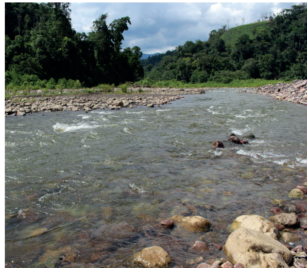
Figura 4. Río Blanco, afluente río Horta, cuenca río Carare.

alta de la cuenca del río Cauca (ríos Bugalagrande, Ansermanuevo y La Vieja) y la cuenca alta del río Magdalena en los departamentos de Tolima y Huila: ríos Coello, Opía, Tetúan, Peralonso, Anchique, Pata y quebradas Gualanday y La Fragua (Maldonado-Ocampo et al. 2005, Villa-Navarro et al. 2006). En colecciones posteriores ha sido registrada para los ríos Totare y Alvarado (Figura 5).