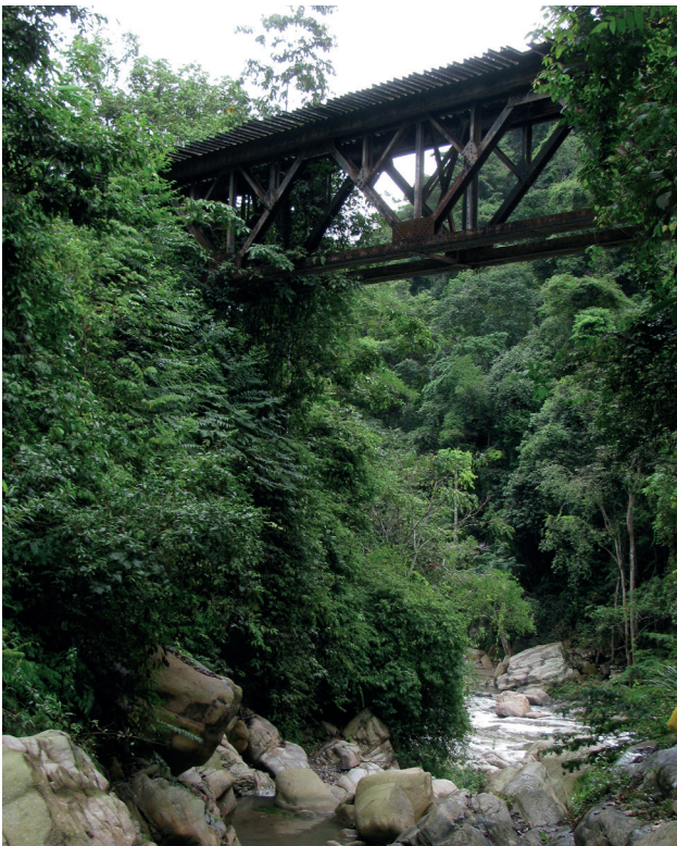
Figura 3. Quebrada NN, afluente del río Lebrija, sector de la antigua vía del ferrocarril.