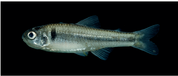
Figura 1. Microgenys minuta (27 mm LE), IAvH-P-15805.