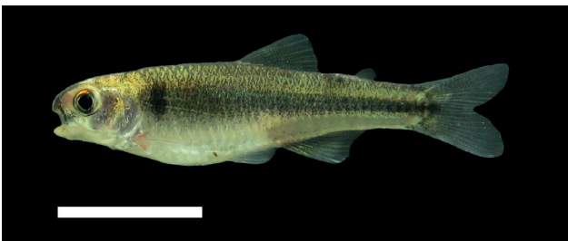
Figura 2. Microgenys minuta , CZUT-IC-10722.