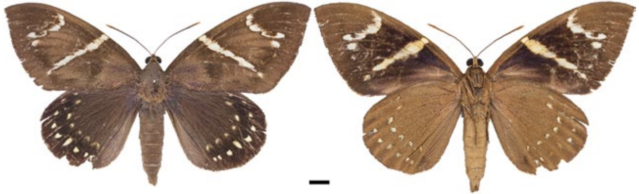
Figura 1. Macho, Eupalamides guyanensis (IAvH-E-163305). A la izquierda vista dorsal, a la derecha vista ventral.

ala anterior (Korytkowski y Ruiz 1979, González y Fernández 1993, Lamas 1993, Aldana y Calvache 2002, Aldana et al. 2004, Bustillo et al. 2013).