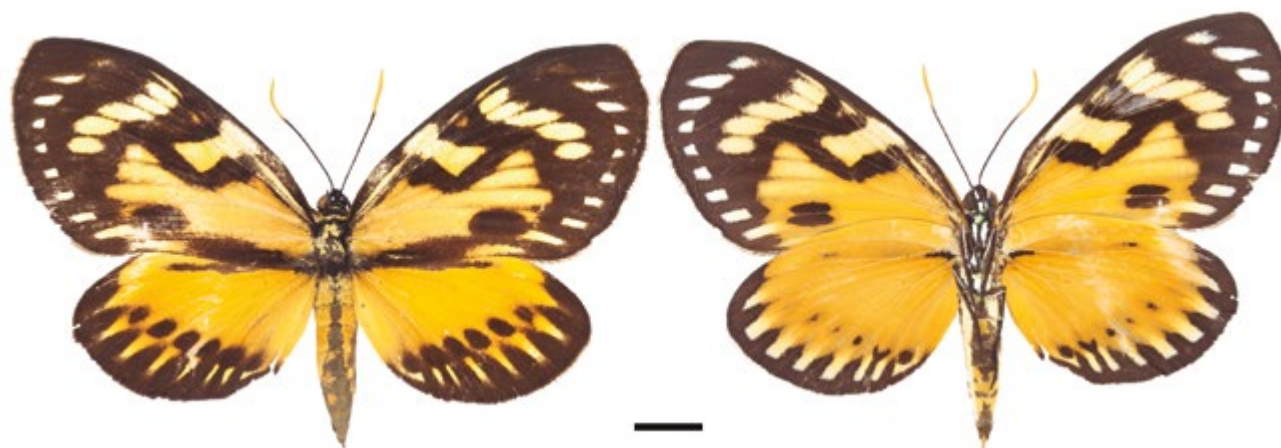
Figura 5. Hembra Prometheus zagraea (IAvH-E-3978). A la izquierda vista dorsal, a la derecha vista ventral.

entre la especie P. zagraea y su potencial modelo Pterourus zagreus (Doubleday, 1847) (Papilionidae) (Miller 1986). El papilionido P. zagreus tiene un rango de distribución parcialmente similar al castnido P. zagraea y, además presenta una significativa variabilidad intraespecífica en cuanto a sus patrones de coloración alar (Le Crom et al. 2002, Racheli et al. 2012). Lo anterior puede explicar la significativa variabilidad en cuanto al patrón de coloración alar presentado por P. zagara , ya que al cambiar la morfología de una especie modelo según una distribución geográfica, también podría cambiar la presentada por la especie mimo (Hernández-Baz et al. 2012).