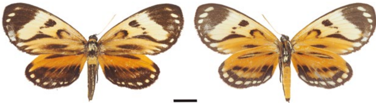
Figura 4. Hembra, Prometheus ecuatoria (IAvH-E-6639). A la izquierda vista dorsal, a la derecha vista ventral.

registra en los departamentos de Boyacá, Guaviare, Meta, Cauca y Putumayo (Salazar 1999, González y Salazar 2003). No se conocen sus plantas hospederas (Vinciguerra y Racheli 2006), presenta varios fenotipos y 8 subespecies (Lamas 1995). Además, tiene una amplia variación en el patrón de coloración de esta especie, su marcado dimorfismo sexual y la escasez de ejemplares en colecciones biológicas impiden la correcta identificación subespecífica (Miller 1986).