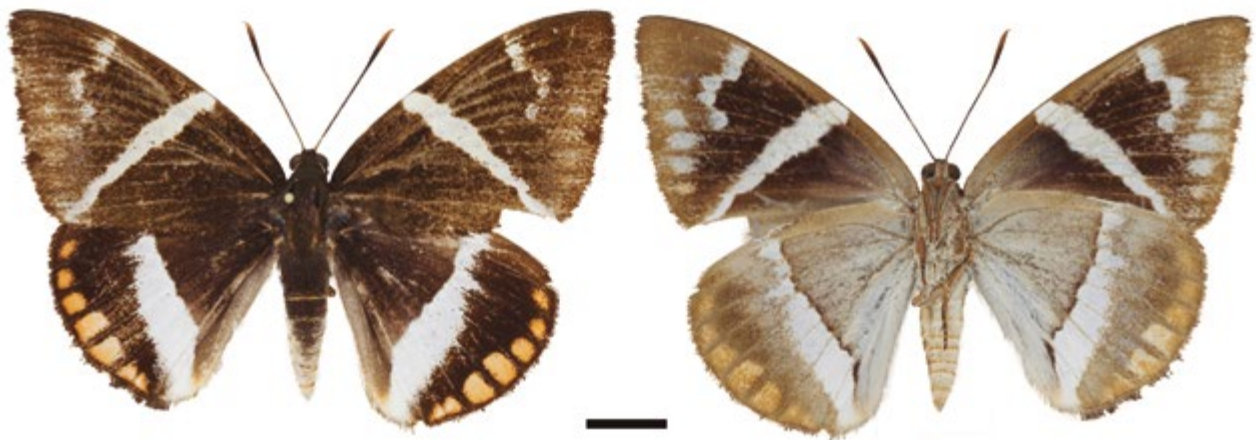
Figura 8. Macho, Telchin licus IAvH-E-153402. A la izquierda vista dorsal, a la derecha vista ventral.

Duarte 2009). Es reconocida por su interés agrícola en la caña de azúcar ( Saccharum officinarum L.: Poaceae) aunque puede tener un rango relativamente amplio de plantas hospederas (González y Stünning 2007, González et al. 2013). Telchin licus cuenta con 12 subespecies definidas por variaciones mínimas de los patrones de coloración y localidad tipo (Lamas 1995, Moraes y Duarte 2014). La identificación a nivel subespecífico de T. licus es confusa y amerita estudios más completos que incluyan caracteres moleculares (Silva-Brandão et al. 2013). Por lo anterior, se decide no ubicar los ejemplares en alguna de las subespecies.