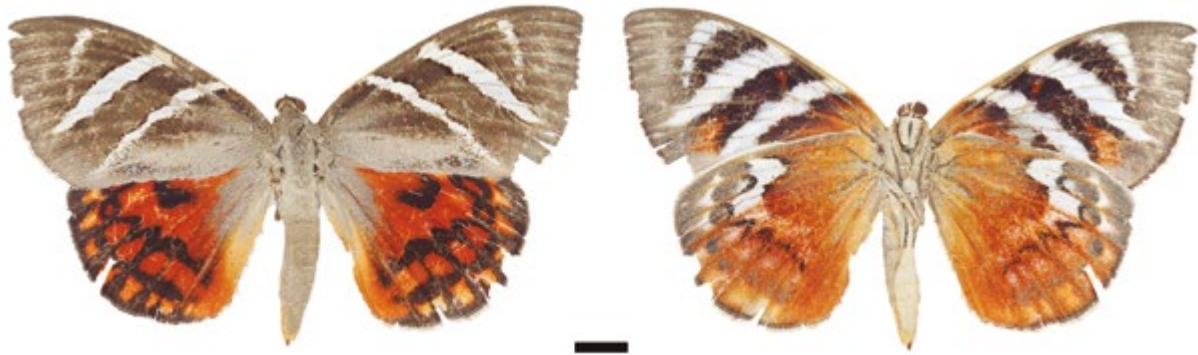
Figura 3. Macho Castnia invaria volitans (IAvH-E-108856). A la izquierda vista dorsal, a la derecha vista ventral.