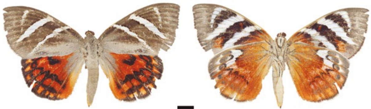
Figura 2. Hembra, Castnia invaria volitans (IAvH-E-41494). A la izquierda vista dorsal, a la derecha vista ventral.

Comentarios: Esta subespecie está ampliamente distribuida en el norte de Suramérica hasta la Amazonia y se encuentra asociada a plantas de la familia Bromeliaceae, siendo considerada de interés agrícola ocasional en el cultivo de la piña (González y Fernández 1993, González et al. 2013). Esta especie puede presentar variación en cuanto a coloración y tamaño (González 2003).