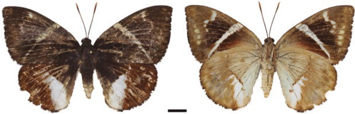
Figura 6. Macho Telchin atymnius (IAvH-E-153776). A la izquierda vista dorsal, a la derecha vista ventral.

150 msnm, B. Amado. Leg. M.842. IAvH-E-153401.