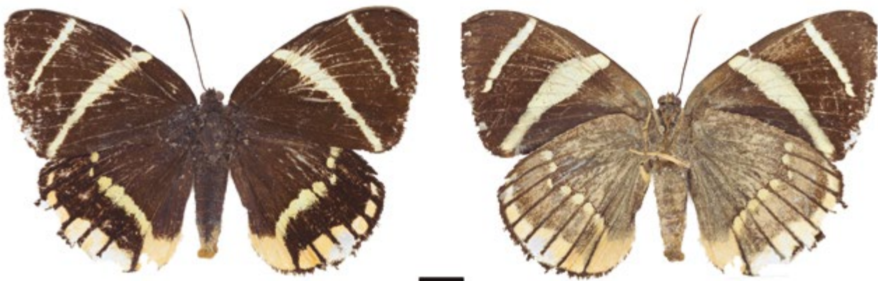
Figura 7. Hembra, Telchin evalthe (IAvH-E-153401). A la izquierda vista dorsal, a la derecha vista ventral.

Material examinado: 1 ♂. Colombia, Meta, Villavicencio, Universidad de los Llanos. 04°09'N, 73°38' W, 467 m s.n.m. 13-Abr-2012 J. Cómbita Leg. IAvH-E-153773. 1 ♂. Colombia, Meta, Villavicencio,