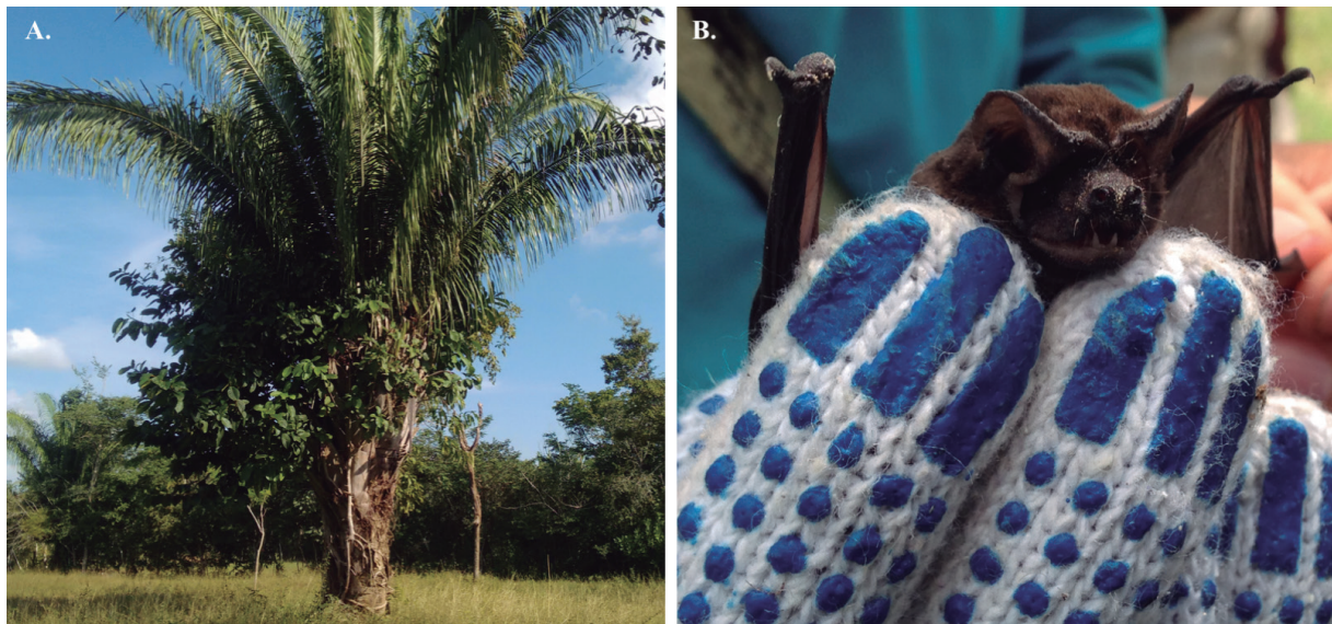
Figura 3. A) Palma de vino ( Attalea butyracea ) en la finca Mi Ranchito (Galeras, Sucre, Colombia). B) Molossus sp. encontrado en la corona de hojas de Attalea butyracea .