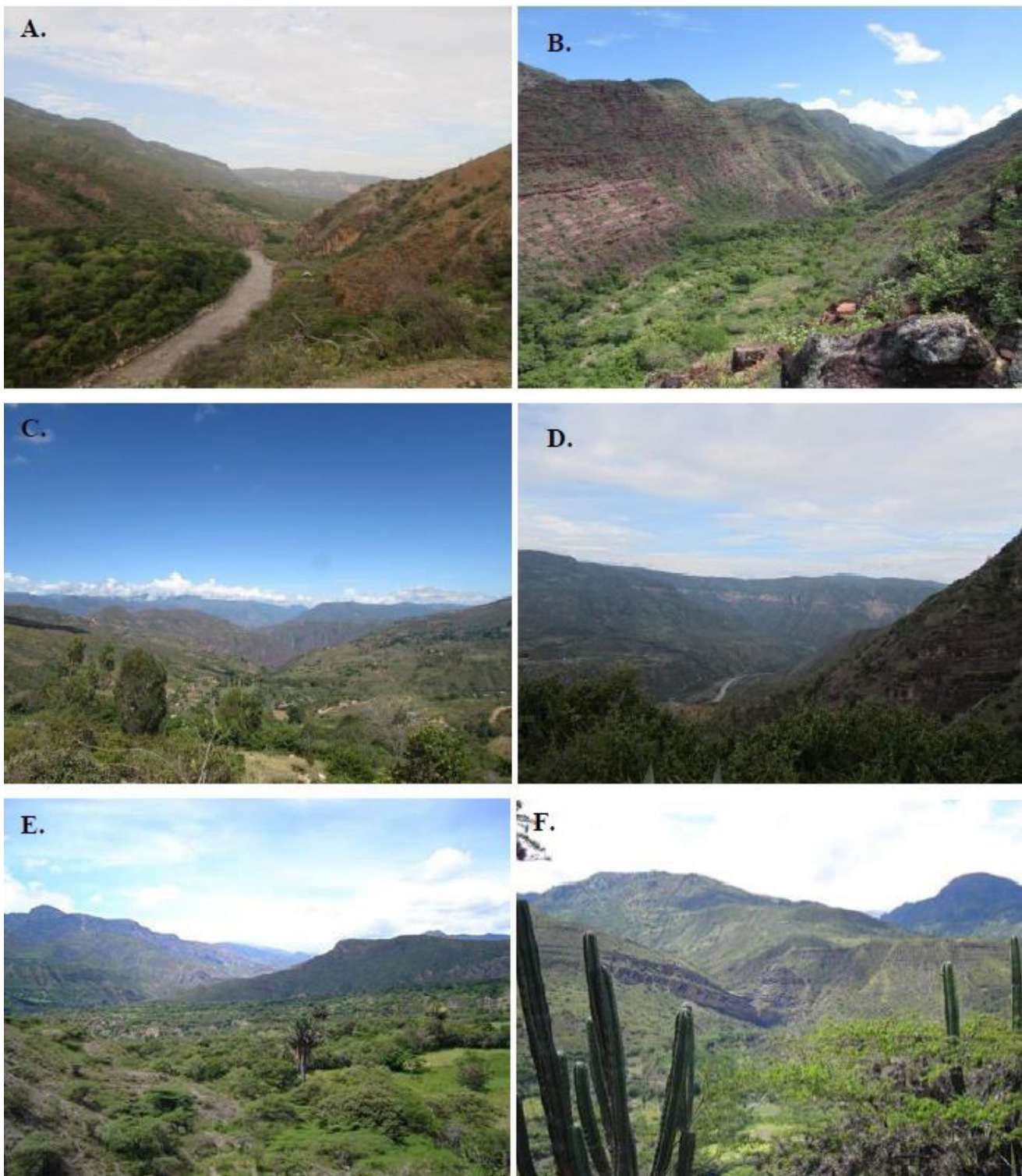
Figura 2. Paisajes de algunas localidades de estudio visitadas en el Cañón del Chicamocha, Colombia. Santander: A, Jordán-Los Santos; B, Los Fríos-Los Santos; C, La Purnia-Los Santos; D, La Mojarrá-Los Santos. Boyacá: E y F, Soatá.