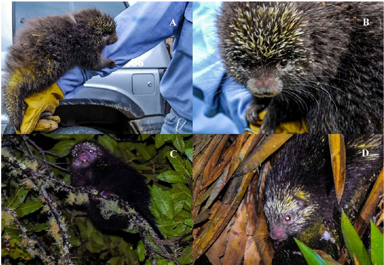
Figura 1. Registros recientes de Coendou vestitus en Boyacá, Colombia. A-B, individuo de Villa de Leyva (2015); C-D, individuo de Gachantivá (2018). Nótese el tamaño corporal pequeño, la cola corta, el pelaje dorsal largo de color negruzco que oculta las espinas de manera parcial, y las cerdas bicoloras.

Figure 1. Recent records of Coendou vestitus in Boyacá, Colombia. A-B, individual from Villa de Leyva (2015); C-D, individual from Gachantivá (2018). Note the small body size, short tail, long blackish dorsal fur concealing the quills, and bicolored bristle-quills.